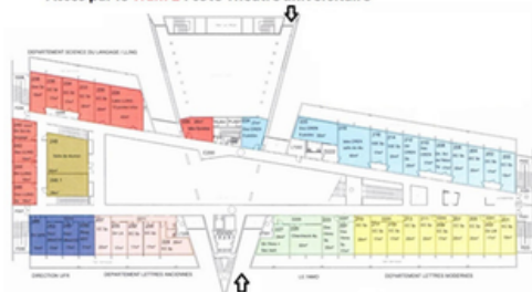
Accès par les Bus 20 ou 80 : côté Chemin de la Censive du Tertre